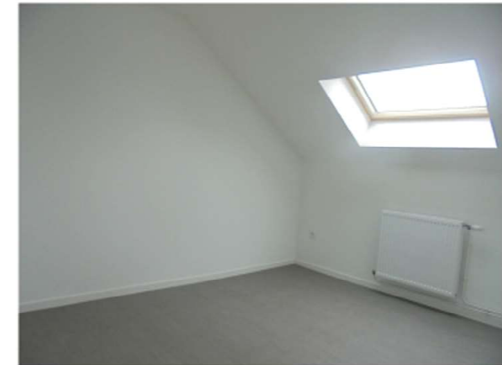
PHOTOS INTERIEURES APRES TRAVAUX