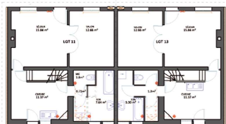
ETAT PROJETE - PLAN RDC

En effet, une isolation extérieure type Bardage Cédral a été posée sur chacun des pignons des logements après un rejointoiement des briques existantes. La toiture a été remplacée et isolée avec ajout de velux afin d'éclairer la nouvelle chambre créée pour chacun des logements à l'étage. Les menuiseries extérieures ont été remplacées par des menuiseries bois double vitrage à faible émissivité avec volets roulants intégrés. L'installation électrique, la plomberie/sanitaire et la VMC ont été remplacées et/ou mises aux normes. Les logements ont été rééquipés de nouvelles chaudières à condensation, de VMC hygroréglables, de nouveaux radiateurs et d'équipements sanitaires. Enfin, l'intérieur des logements a été rafraîchi et redistribué à l'étage avec la création d'une nouvelle chambre. L'ensemble des murs ont été replaqués, ré-enduit et repeint et les nouveaux sols souples posés dans l'ensemble des logements.